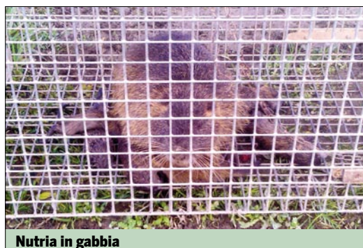
Nutria in gabbia